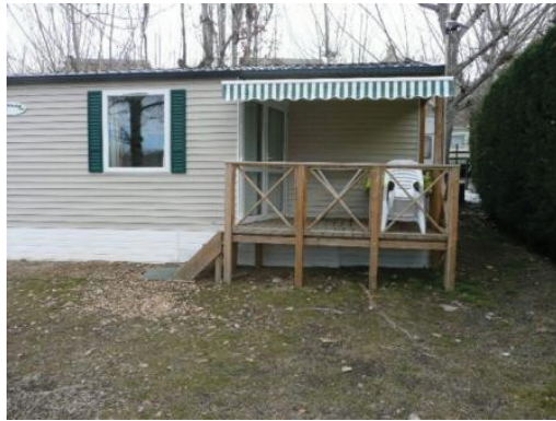
Mobil Ohara (2008) 27 m 2